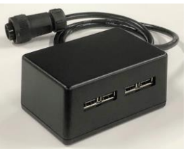
一体型専用 USB(4口)充電アダプタ