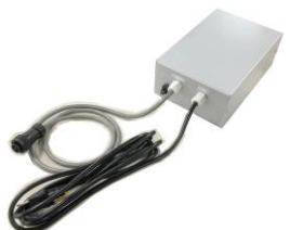
一体型専用 AC100V急速充電器