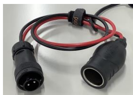
一体型専用 シガーソケットアダプタ