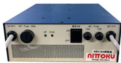
連結型専用 AC100V充電器

連結型製品に対しては、指定コネクタを接続して市販のソーラーパネルで充電入力することが可能です。但し、電圧、電流の仕様を製品の仕様と合わせないと危険ですので、必ずNITTOKUにご相談いただき、承認されたソーラーパネルをお使いください。